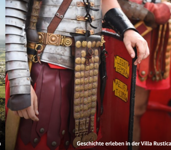
Geschichte erleben in der Villa Rustica