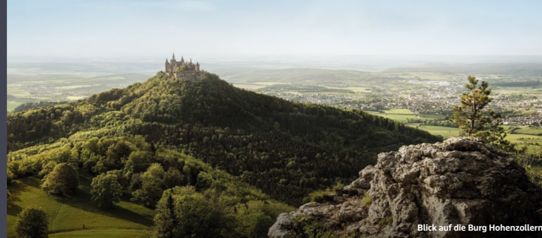
Blick auf die Burg Hohenzollern