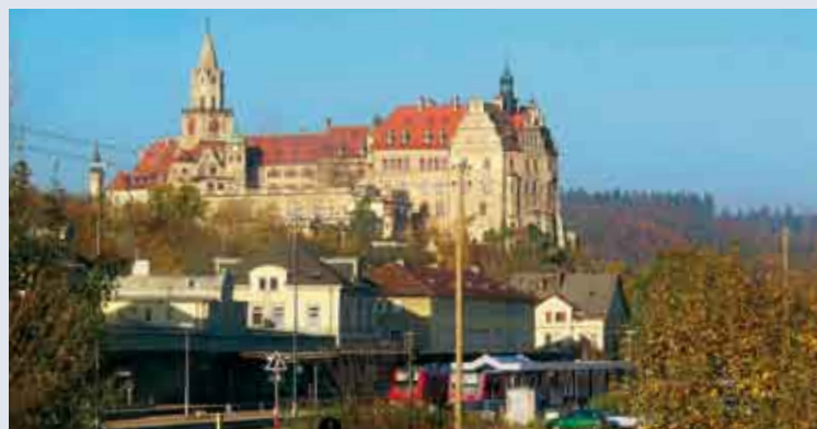
Bahnhof und Schloss Sigmaringen

Trotzdem kann man einfach nicht von einem echtem „Hauptstadt-Flair“ sprechen. Schließlich wurde die „Vichy“-Regierung von den Alliierten nicht anerkannt und der Chef dieser „Regierung“, Marschall Pétain, fühlte sich eher als Kriegsgefangener. Die Anwesenheit dieser „Regierung“ war es dann, die Sigmaringen zu einem der wichtigsten Kriegsziele der Franzosen unter de Gaulle machte.