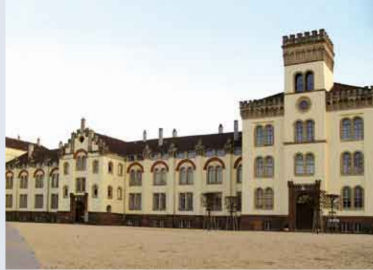
Thiepval-Kaserne südlich des Tübinger Bahnhofs – die 1875 errichtete Kaserne nutzte auch die französische Armee

Ein herrlicher Sommertag im Jahr 1947. Am Haltepunkt Gomaringen herrscht viel Betrieb. Aber warum hört man nur Französisch? Und warum steigen nur Soldaten in Uniform ein und aus? Gomaringen gehörte nach dem Ende des Zweiten Weltkrieges zur französischen Besatzungszone im neu geschaffenen Land „Württemberg-Hohenzollern“. Auch das bis dahin preußische Hohenzollern war darin aufgegangen. Und Landeshauptstadt war ... nein, nicht Stuttgart, sondern Tübingen! Natürlich mit einer starken französischen Militärpräsenz. Obwohl in den französischen Garnisonstädten Tausende von „Franzosenwohnungen“ nach einheitlichem Muster gebaut wurden, waren diese in Tübingen damals Mangelware. Deshalb wurden französische Besatzungssoldaten und ihre Familien im nahe gelegenen Gomaringen einquartiert. Um ihnen den Einkauf oder Schulbesuch in den französischen Einrichtungen in Tübingen zu erleichtern, machte die französische Militärverwaltung kurzen Prozess: Auf eigene Kosten musste die Gemeinde ein Bahnhofsgebäude erstellen.