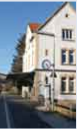
Haltepunkt Straßberg- Winterlingen