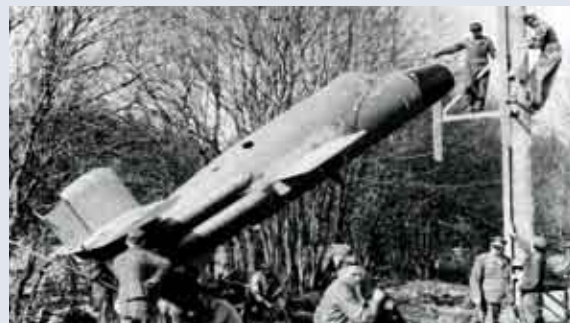
Start der „Natter“

Übrigens: Neben diesem „badischen“ gab es bei Münsingen auch einen von Württemberg begründeten Truppenübungsplatz auf der Alb. Der ist heute ein Schutzgebiet.