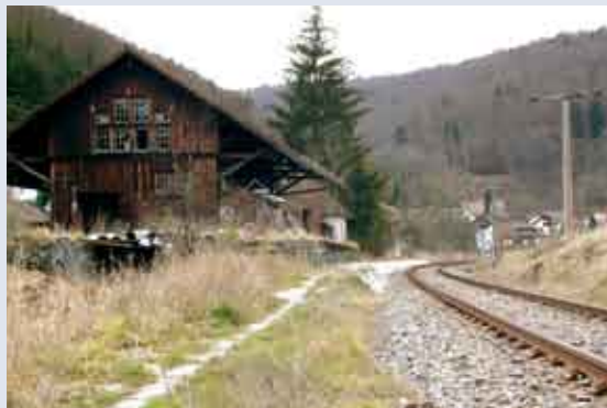
Ehemaliger Haltepunkt Kaiseringen