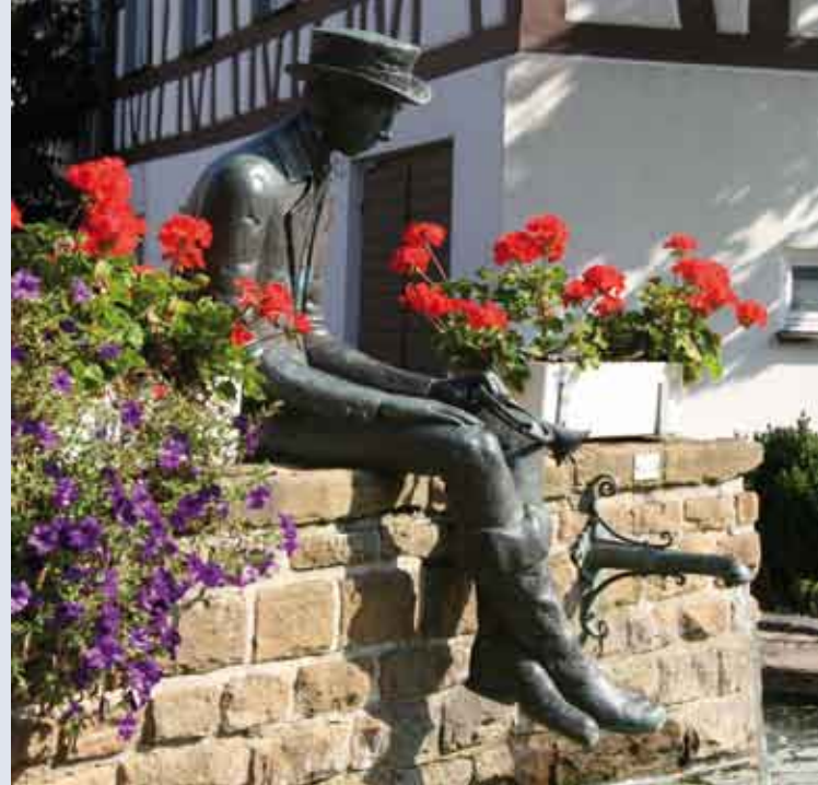
Lenaudenkmal in Steinhofen

Bereits seit dem Mittelalter führte diese „Schweizer Straße“ genannte Fernverbindung von Cannstatt nach Schaffhausen. Nicht nur für Lenau, auch für andere Berühmtheiten war sie eine wichtige Verbindung in den Süden. So beschreibt Johann Wolfgang von Goethe die Poststraße in seiner im Jahre 1797 angetretenen „Reise in die Schweiz“. Könige und Kaiser, aber auch Vaganten, Musikanten, Soldaten und Gesellen auf der Walz nutzten die Straße für ihre Reisen.