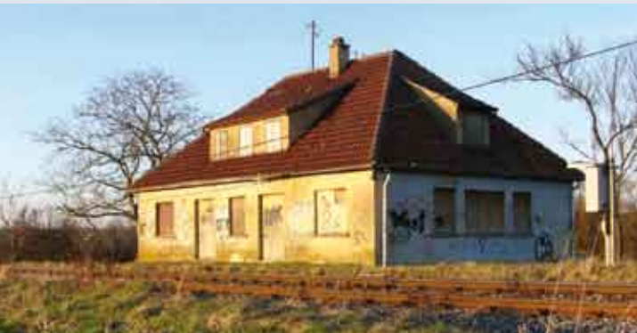
ehemaliger Haltepunkt Gomaringen