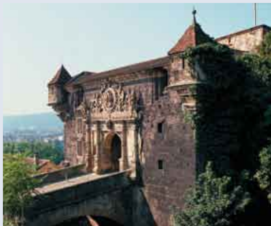
Schloss Schloss Hohentübingen

Die Pfalzgrafen von Tübingen waren es, die hier mit ihrer Burg eine uralte Furt über den Neckar bewachten. Der heutige Schlossbau geht auf eine Anlage der württembergischen Grafen und späteren Herzöge zurück. Schon früh erkannten diese, was spätestens seit der Pisa-Studie Allgemeingut ist: Wissen ist Macht! Kein Wunder also, dass sie bereits 1477 eine der ältesten deutschen Universitäten hier gründeten. Bis heute sind einige ihrer Institute im Schloss Hohentübingen untergebracht, darunter auch die Archäologie.